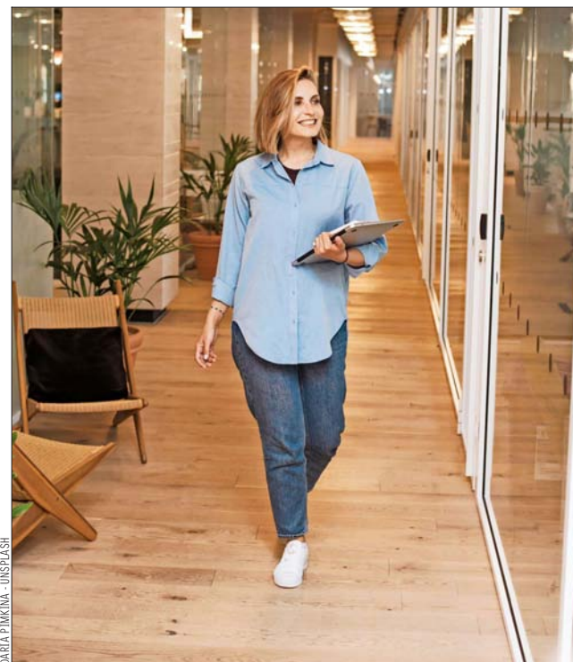
NO ES UNA MODA PASAJERA.— La inclusión es hoy parte de la estrategia de negocios de las principales organizaciones alrededor del mundo.

“Se trata de rubros que se caracterizan por ofrecer buenos salarios, pero tener una baja participación femenina. También suele observarse baja presencia relativa en áreas como operaciones en turnos o esquemas rígidos de jornada, donde